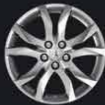
Llanta de aluminio de 17" Estilo 05*