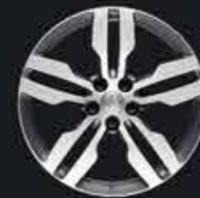
Llanta de aluminio de 18" diamantada*