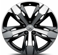
LOS ANGELES 18" Allure y GT-Line