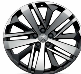
BOSTON 19" GT